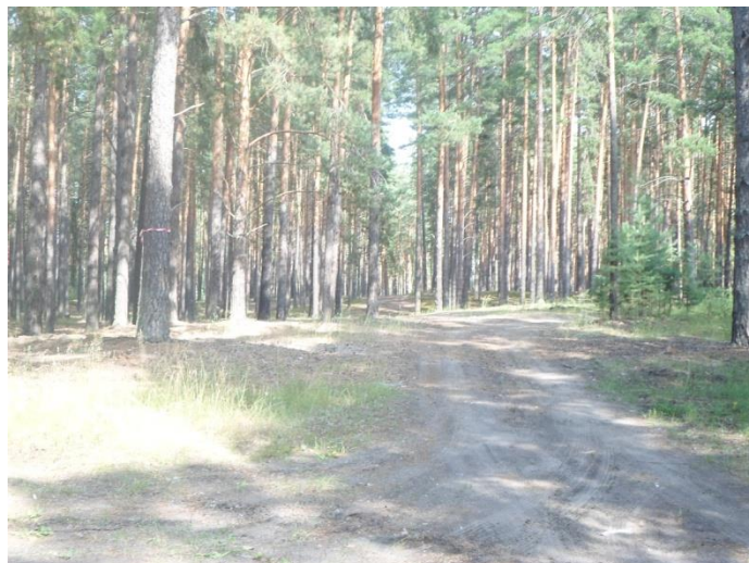
Первый поворот на лево