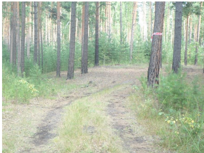
На дереве справа видна маркировка