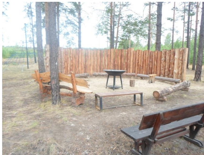
Место приготовления пищи